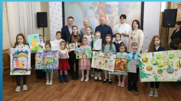
Поддравляем победителей конкурса!

«Город для белок»: в Красноярске выбрали детские идеи для домов пушистых обитателей Центрального парка. Кто победил в необычном конкурсе рисунка. В Красноярске в Краевой научной библиотеке наградили юных участников конкурса «Белкоград» — нарисуй дом для белок в Центральном парке». На конкурс рисунков про белочий город юные красноярцы прислали 196 работ. Победители получили призы от компании РУСАЛ, которая финансирует масштабную реконструкцию парка. По эскизам ребят инженеры спроектируют настоящий Белкоград. В конкурсе рисунков лучшего дома для белок Центрального парка Красноярска приняли участие ребята от 4 до 14 лет. Организаторы предложили участникам пофантазировать, в каких домах могут проживать белочки и как будет выглядеть целый белочий город. Дети серьезно подошли к поставленной задаче — кроме рисунков они прислали еще и развернутые описания необычных жилищ. Идея проведения конкурса развилась после того, как Центральный парк перед реконструкцией обследовали технические специалисты и увидели живущих прямо в центре города зверьков. Белки темного окраса жили здесь давно, а дружок — более светлых рыжих, 4 года назад привезли из Ленинградской области. Сейчас белки являются одним из неофициальных символов главного городского парка — на территории их уже 13, и у каждой белочки свое имя.