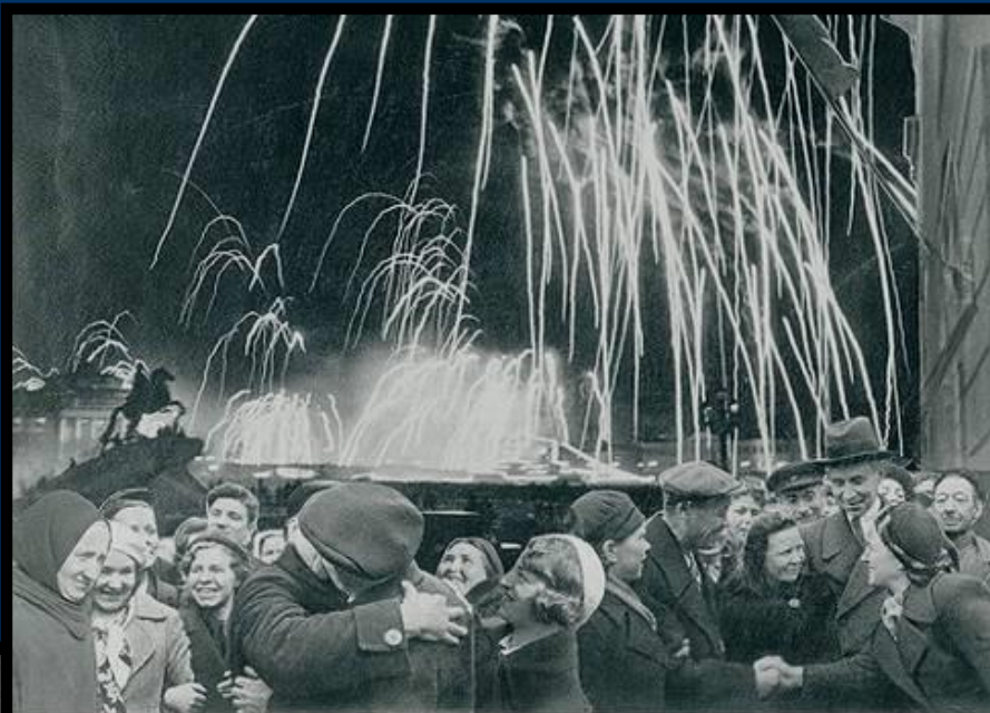
-Великая победа одержана советскими войсками под Ленинградом:

Победе радовалась вся страна, но эта радость была со слезами на глазах, так как в каждой семье, в каждом доме кто-то погиб на этой страшной войне.