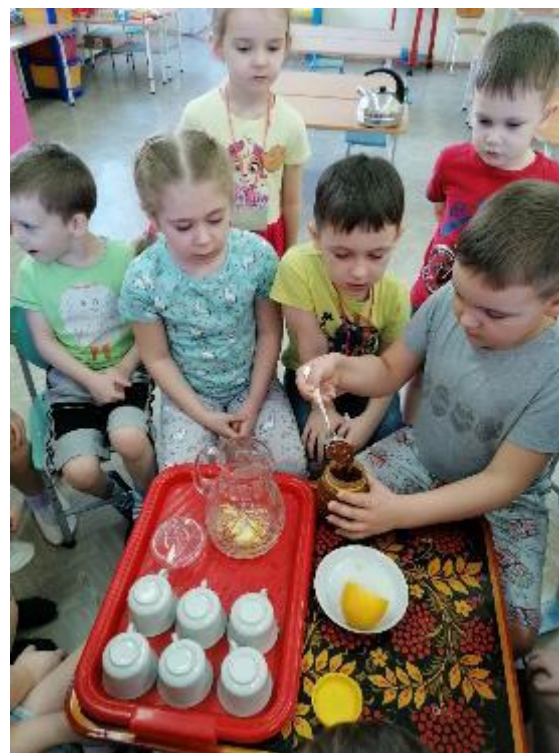
Информационно-исследовательский проект «Лимонад»