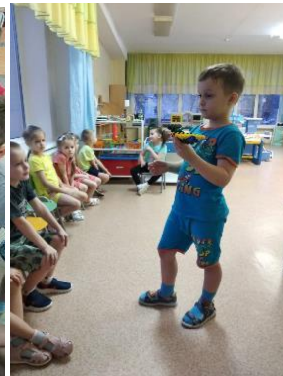
Технический проект «Космические тела»