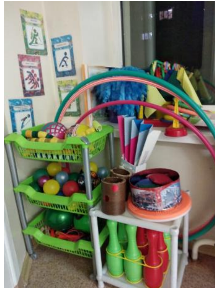
Центр двигательной активности