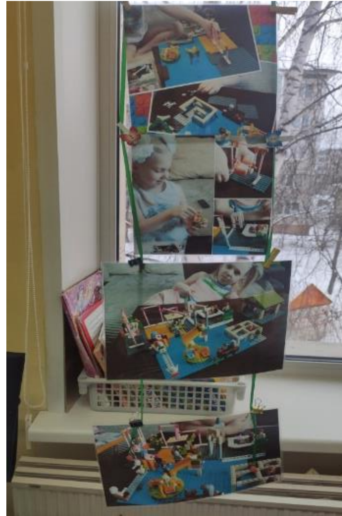
Выставка «Детская Lego- площадка»