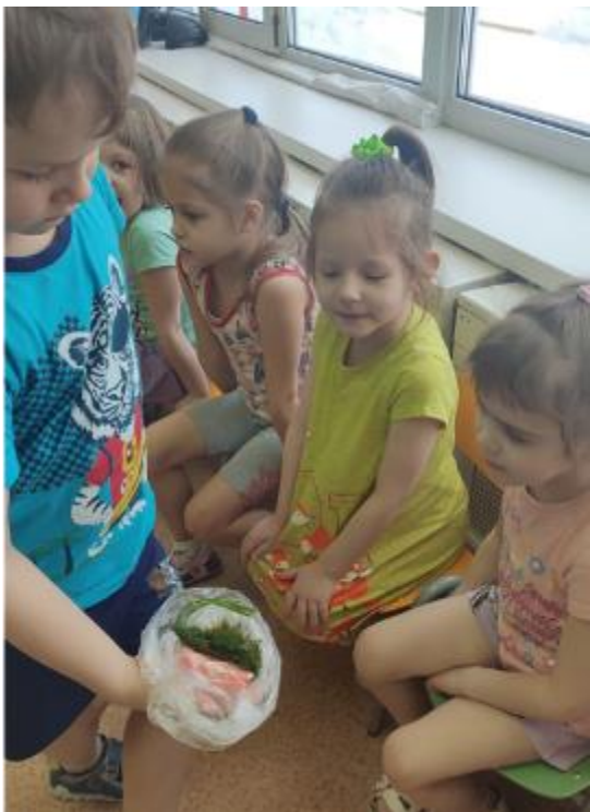
Информационно-исследовательский проект «Как сохранить овощи надолго»

5.1. Среда ДОО развивается, адаптируется с учетом потребностей, ожиданий, возможностей, интересов и инициативы заинтересованных сторон, открывая массу возможностей для индивидуализации образовательного процесса.