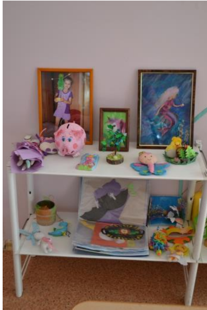
Выставка «Мои увлечения»