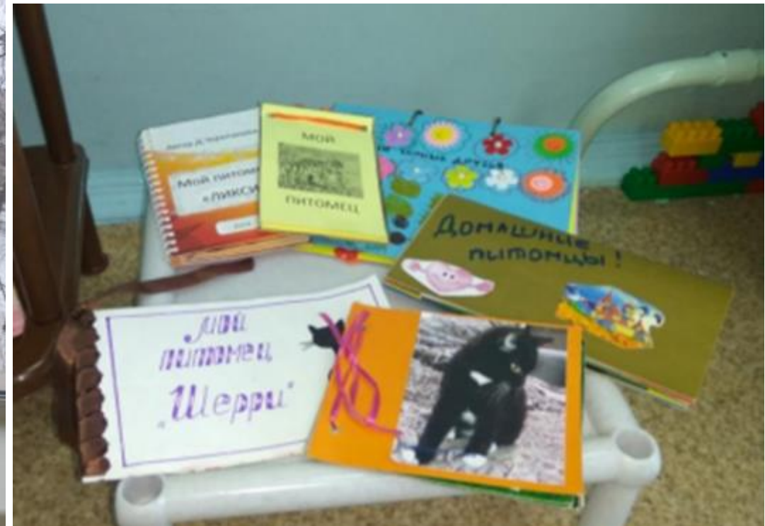
Выставка книг «Мои питомцы»