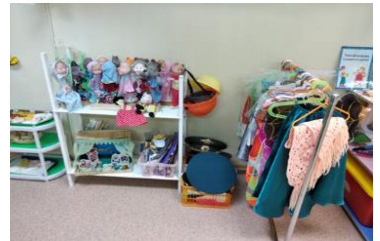
Центр театрализованной деятельности