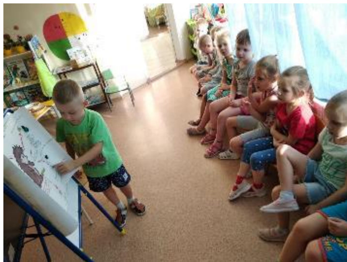
Экологический проект «Ежики»