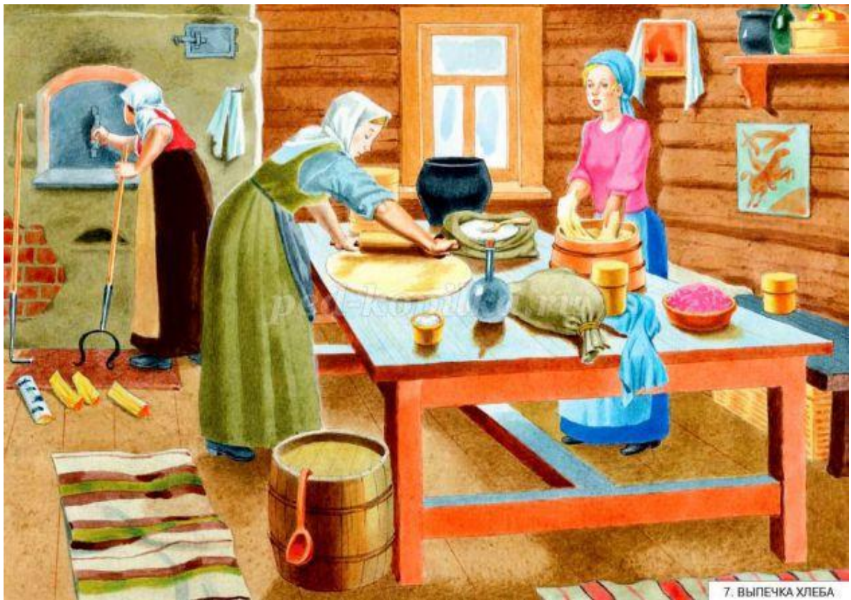
7. ВЫПЕЧКА ХЛЕБА