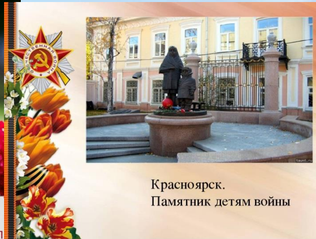
Красноярск. Памятник детям войны