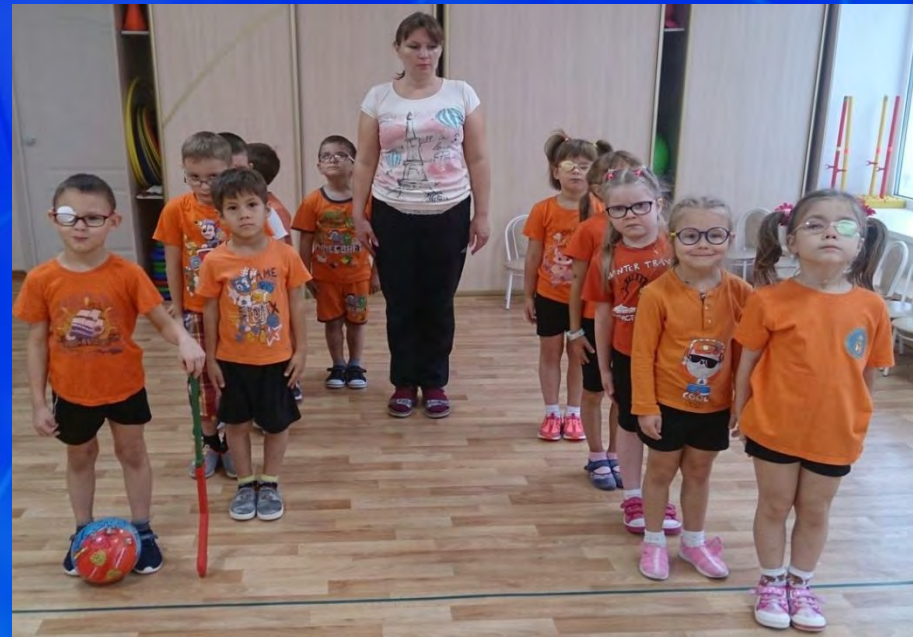
Физкультурные занятия в зале