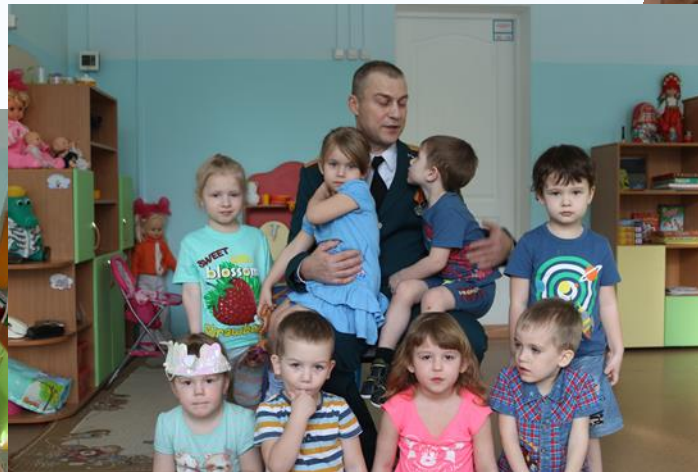
Так мы готовились и проводили праздник «23 февраля»