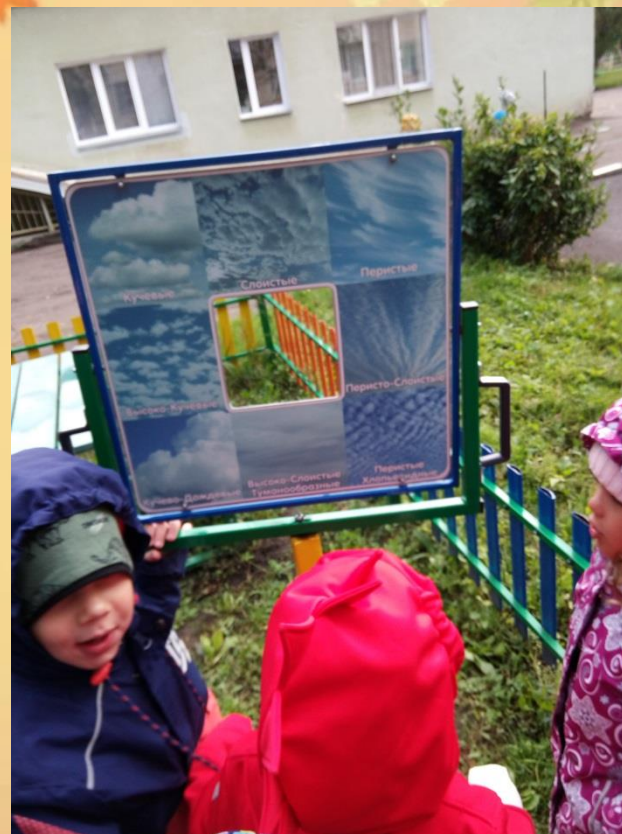
Наблюдали за ветром и познакомились с разными видами облаков