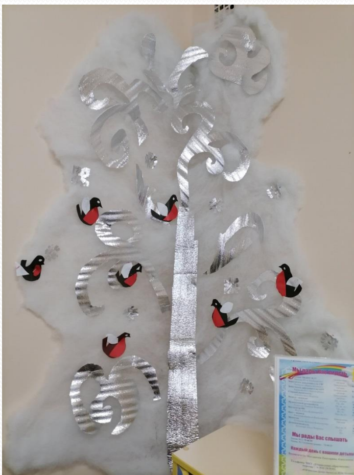
Снегири на заснеженном дереве