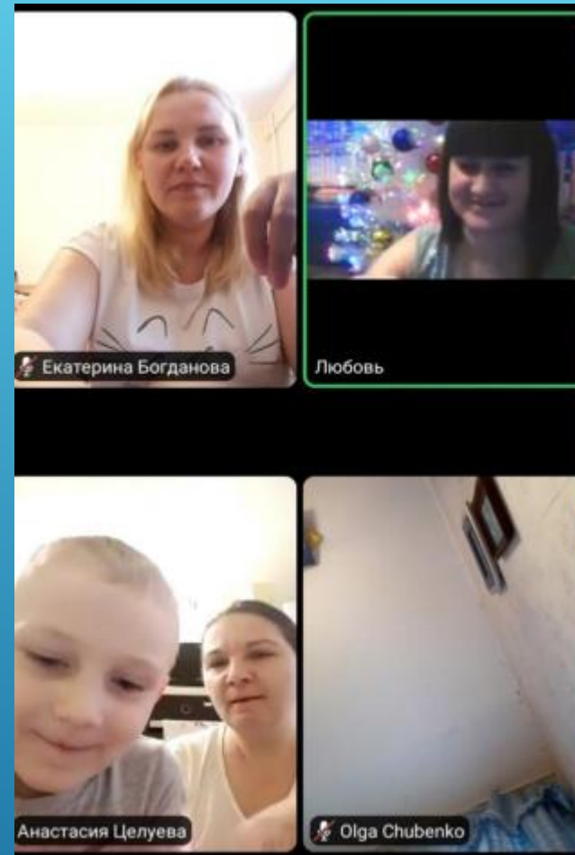
Изготовление ёлочной игрушки для украшения групповой ёлки