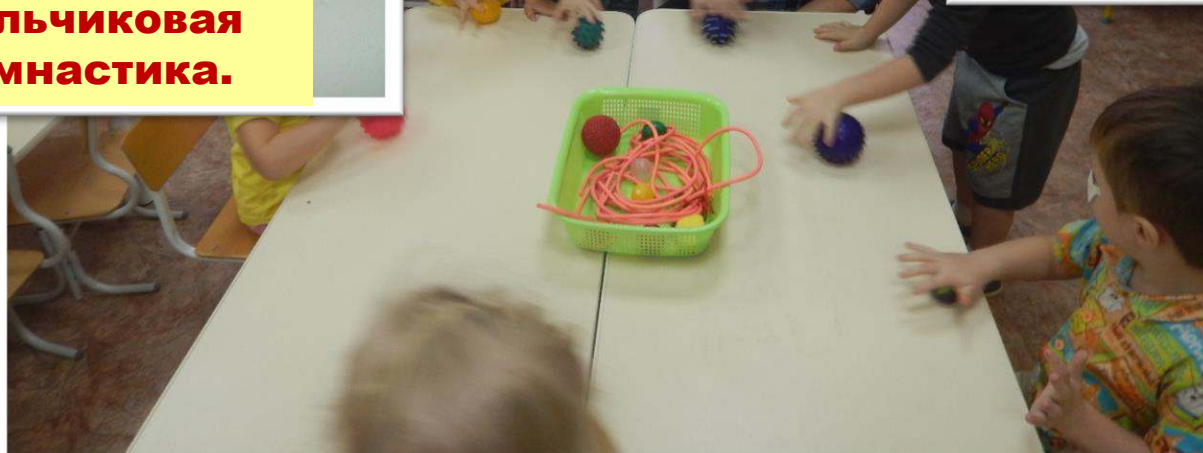
Упражнения с массажными мячиками.