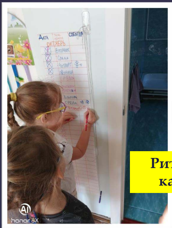
Ритм жизни, календарь