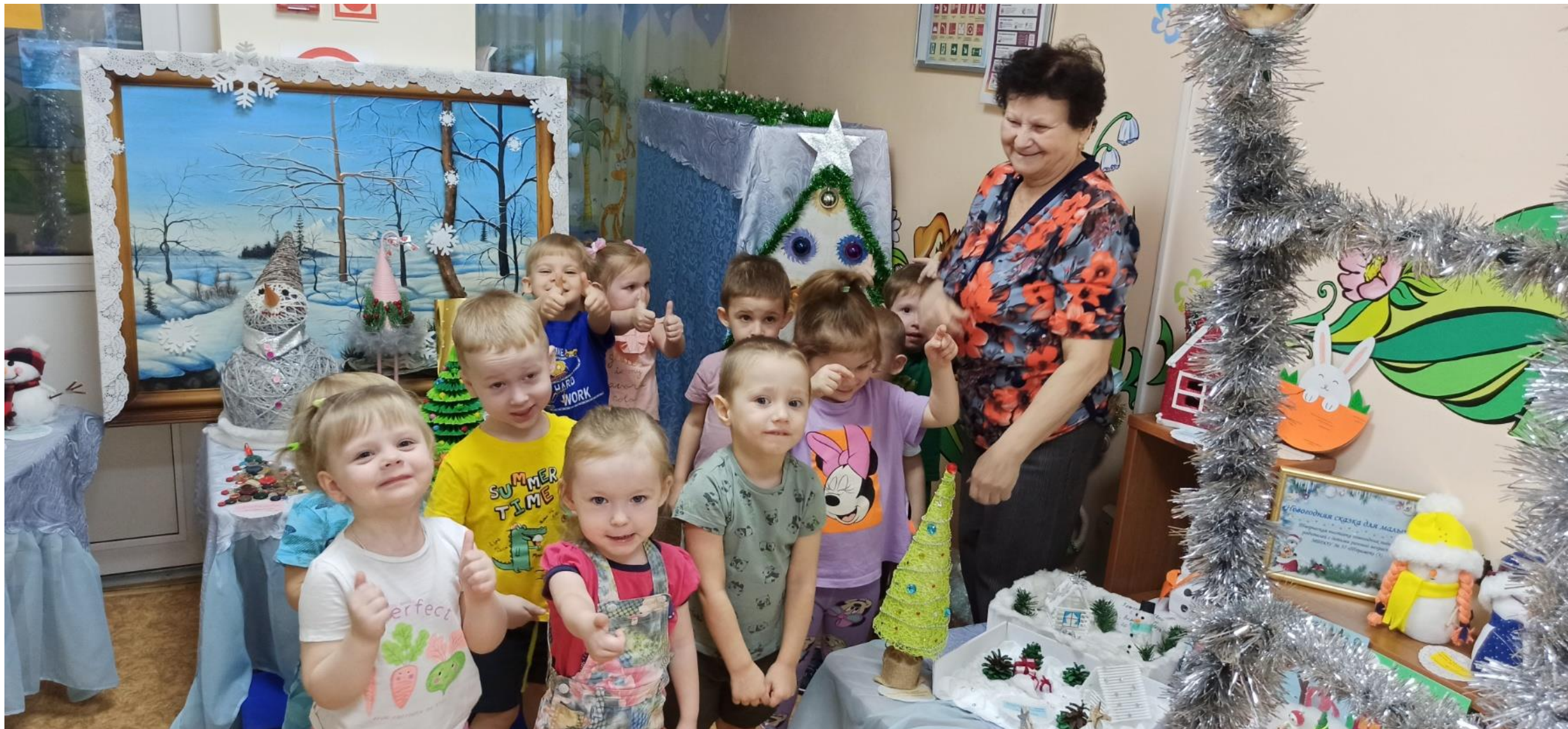
Малыши группы «Ромашки» – участники выставки семейного творчества в детском саду