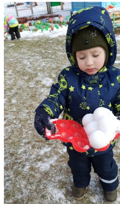
Игры с песком и снегом