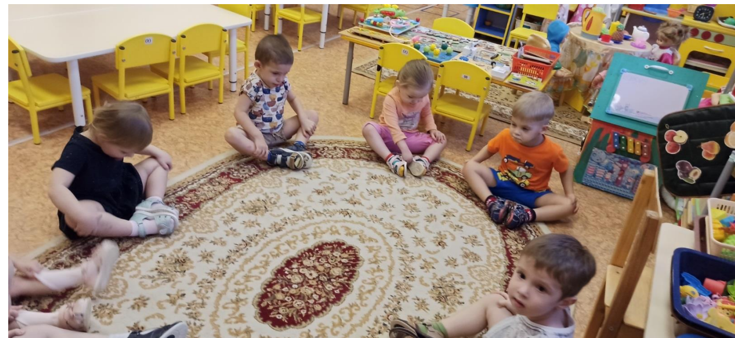
Подвижные игры →