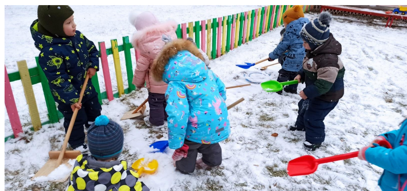
← Подвижные игры