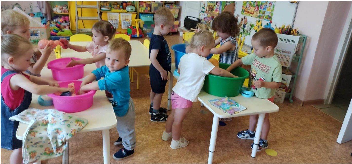
Игры с водой