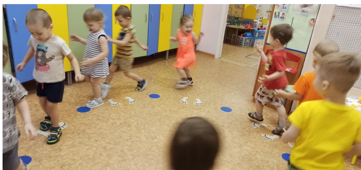
Расширение пространства для двигательных упражнений