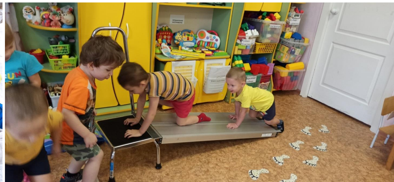
Двигательная деятельность в группе и на участке