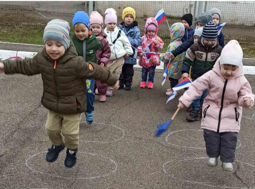
Двигательная деятельность. Прыжки