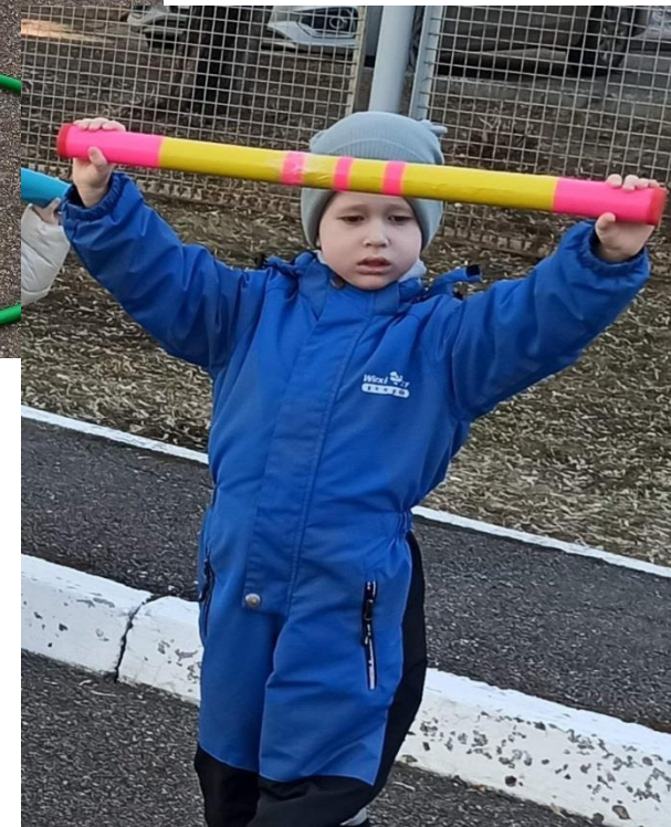
Двигательная деятельность с элементами йоги