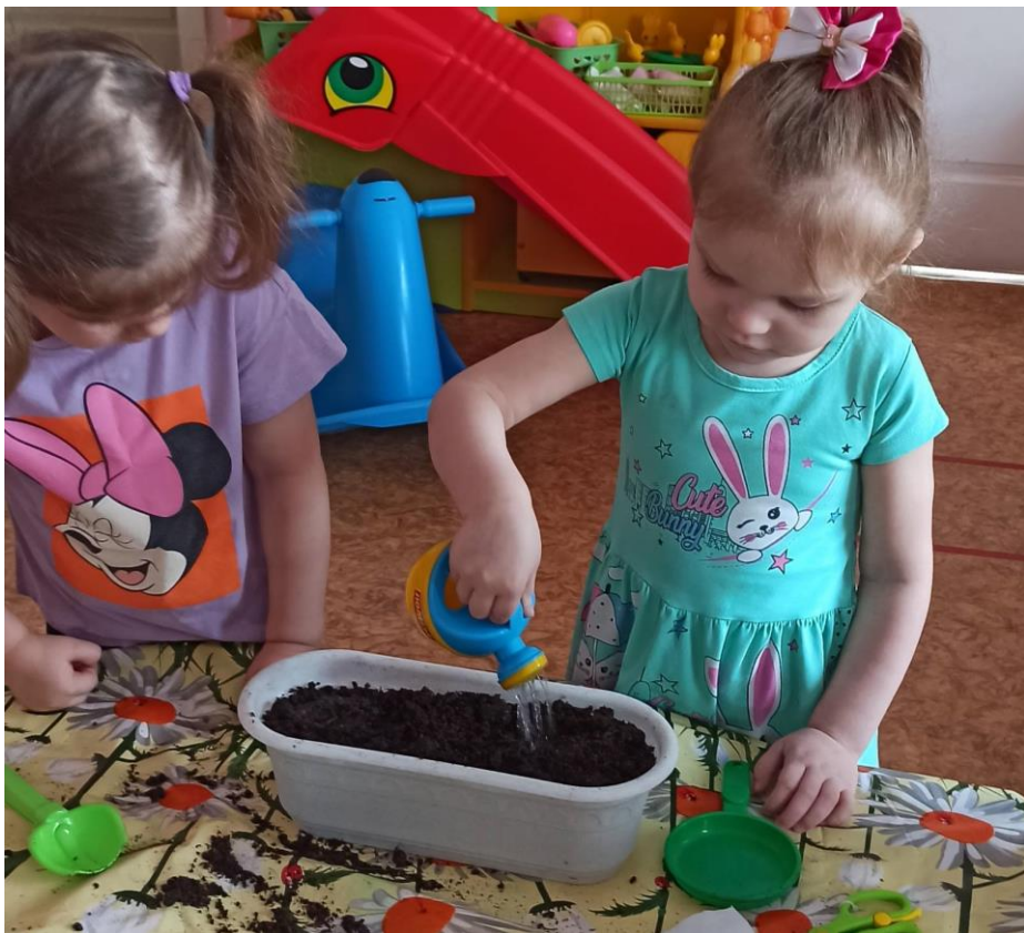
Посадка и полив семян для огорода на подоконнике