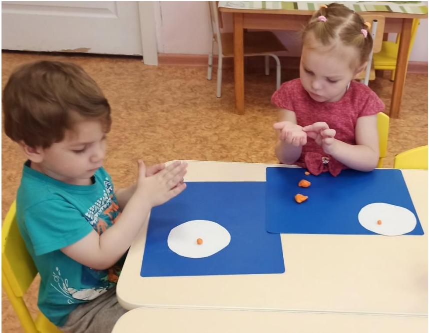
Лепка. Кружковая деятельность «Тестоластика»