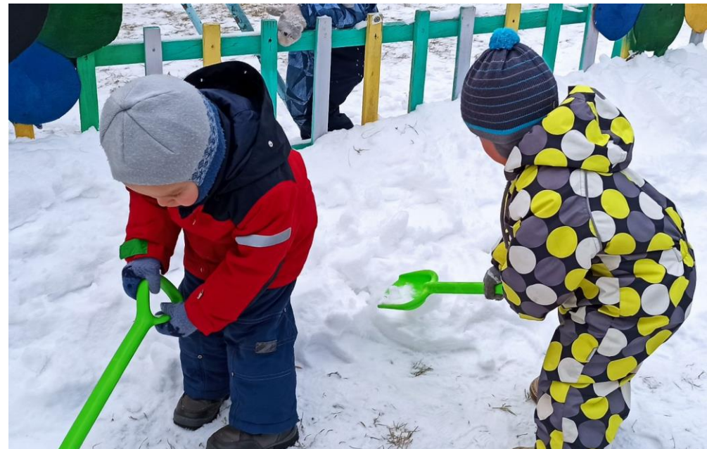
Прогулки. Ознакомление со свойствами снега.