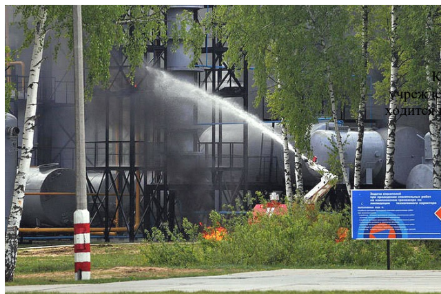
Краевое учреждение ДПО «Институт региональной безопасности» по адресу:

воздержаться от употребления водопроводной или колодезной воды, а также овощей и фруктов из огородов и садов до заключения специалистов об их безопасности.